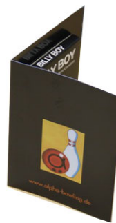
DIN A7 Karte zum Aufklappen mit Kondom