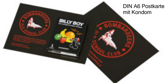
DIN A6 Postkarte mit Kondom

Bei diesem Produkt bringen wir für Sie ein einzelnes Kondom in einer Umverpackung mit einem speziellen Klebepunkt auf einer Postkarte oder aufklappbaren Karte an. Aus verschiedenen Formaten (A7, A6, A5, DIN lang) können Sie das passende Format auswählen (170 – 250 g/m 2 Papier). Gerne gestalten wir die Karte für Sie. Auch ideal, wenn es schnell gehen soll: Wir liefern in 6 bis 7 Arbeitstagen.