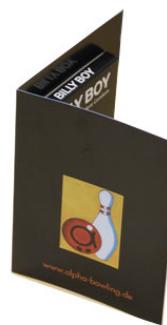
DIN A7 Karte zum Aufklappen mit Kondom