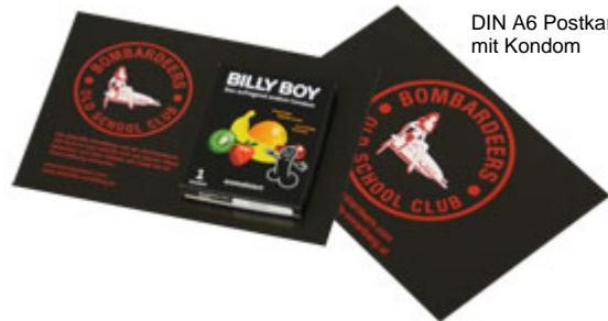
DIN A6 Postkarte mit Kondom

Bei diesem Produkt bringen wir für Sie ein einzelnes Kondom in einer Umverpackung mit einem speziellen Klebepunkt auf einer Postkarte oder aufklappbaren Karte an. Aus verschiedenen Formaten (A7, A6, A5, DIN lang) können Sie das passende Format auswählen (170 – 250 g/m 2 Papier). Gerne gestalten wir die Karte für Sie. Auch ideal, wenn es schnell gehen soll: Wir liefern in 6 bis 7 Arbeitstagen.