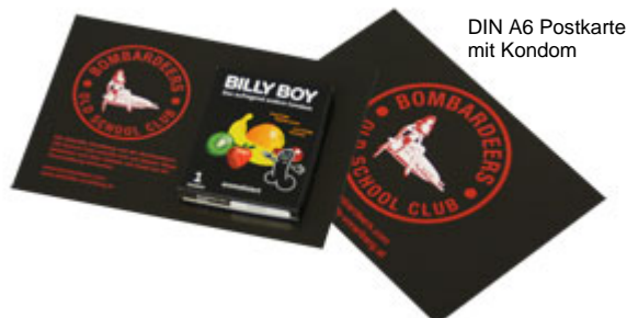
DIN A6 Postkarte mit Kondom

Bei diesem Produkt bringen wir für Sie ein einzelnes Kondom in einer Umverpackung mit einem speziellen Klebepunkt auf einer Postkarte oder aufklappbaren Karte an. Aus verschiedenen Formaten (A7, A6, A5, DIN lang) können Sie das passende Format auswählen (170 – 250 g/m 2 Papier). Gerne gestalten wir die Karte für Sie. Auch ideal, wenn es schnell gehen soll: Wir liefern in 6 bis 7 Arbeitstagen.