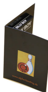
DIN A7 Karte zum Aufklappen mit Kondom